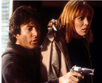
1976 MARATHON MAN (Marathon Man) de John Schlesinger avec Dustin Hoffman