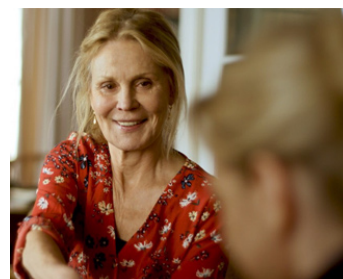
2020 PETITE SŒUR (Schwesterlein) de Stéphanie Chuat et Véronique Reymond