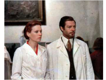
1975 VERTIGES (Per le antiche scale) de Mauro Bolognini avec Marcello Mastroianni