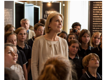
2013 LA MARQUE DES ANGES (Miserere) de Sylvain White