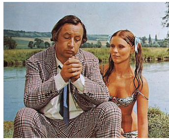
1970 LES CAPRICES DE MARIE de Philippe de Broca avec Philippe Noiret