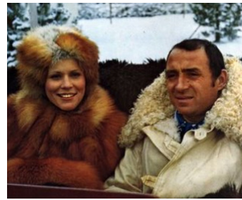
1971 UN CAVE de Gilles Grangier avec Claude Brasseur