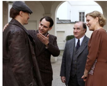
2011 MEIN BESTER FEIND de Wolfgang Murnberger avec Udo Samel, Moritz Bleibtreu