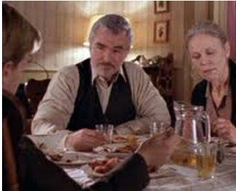
2002 L'ENFANT ET LE LOUP (Time of the Wolf) de Rod Priddy avec Burt Reynolds