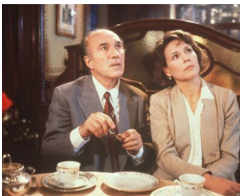
1988 LA RUELLÉ AU CLAIR DE LUNE d'Édouard Molinaro avec Michel Piccoli