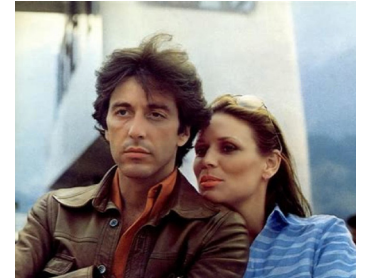
1977 BOBBY DEERFIELD (Bobby Deerfield) de Sydney Pollack avec Al Pacino