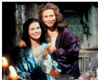
1991 INTRIGUES IMPÉRIALES (Young Catherine) de Michael Anderson avec Julia Ormond