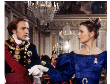
1981 LA CHARTREUSE DE PARME (La Certosa di Parma) de Mauro Bolognini avec Yann Babilée