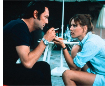
1974 SEUL LE VENT CONNAÎT LA RÉPONSE d'Alfred Vohrer avec Maurice Ronet