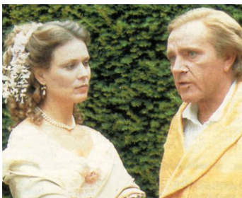
1983 WAGNER (Wagner) de Tony Palmer avec Richard Burton