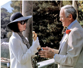
1978 FEDORA (Fedora) de Billy Wilder avec Henry Fonda