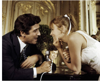
1974 TOUTE UNE VIE de Claude Lelouch avec Gilbert Bécaud