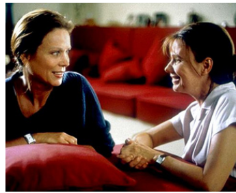
1997 ELLES de Luis Galvão Teles avec Miou-Miou