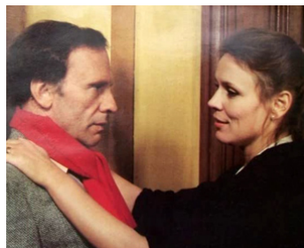
1984 FEMMES DE PERSONNE de Christopher Frank avec Jean-Louis Trintignant