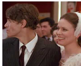
1985 ROUGE BAISER de Vera Belmont avec Laurent Terzieff