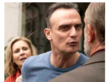
2020 MY WONDERFUL WANDA (Wanda, meine Wunder) de Bettina Oberli avec Jacob Matschenz