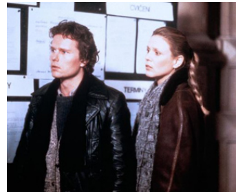
1981 L'HOMME DE PRAGUE (The Amateur) de Charles Jarrott avec John Savage