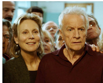
2008 CORTEX de Nicolas Boukhrief avec André Dussollier