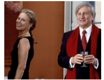
1999 LE DERRIÈRE de Valérie Lemercier avec Claude Rich