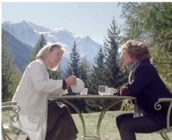
2010 AU-DELÀ (Hereafter) de Clint Eastwood avec Cécile de France