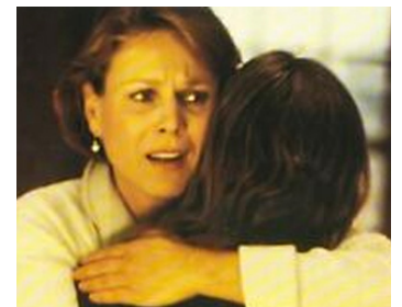
1994 MON AMIE MAX de Michel Brault avec Geneviève Bujold