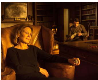
2019 THE WITNESS (The Witness) de Mitko Panov avec Padraic Delaney