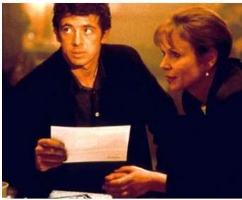
1997 K d'Alexandre Arcady avec Patrick Bruel