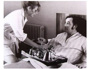
1972 LA VIEILLE FILLE de Jean-Pierre Blanc avec Philippe Noiret