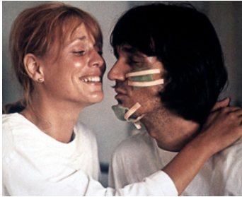
1973 ELLE COURT, ELLE COURT LA BANLIEUE de Gérard Pirès avec Jacques Higelin