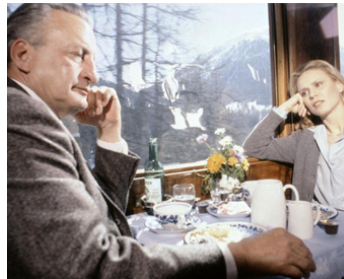
1980 LA FORMULE (The Formula) de John G. Avildsen avec George C. Scott