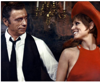
1968 LE DIABLE PAR LA QUEUE de Philippe de Broca avec Yves Montand