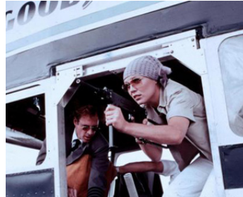
1977 BLACK SUNDAY (Black Sunday) de John Frankenheimer avec Bruce Dern